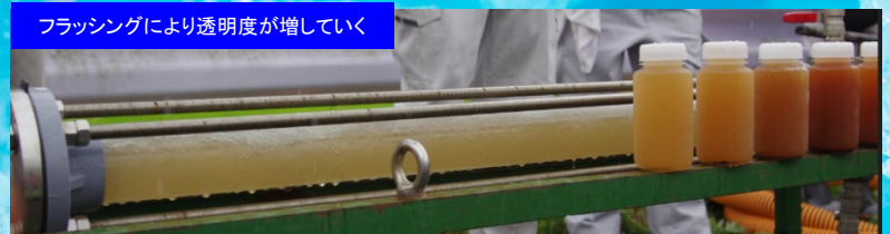
フラッシングにより透明度が増していく