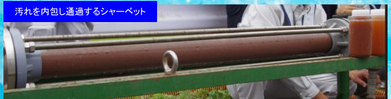
汚れを内包し通過するシャーベット