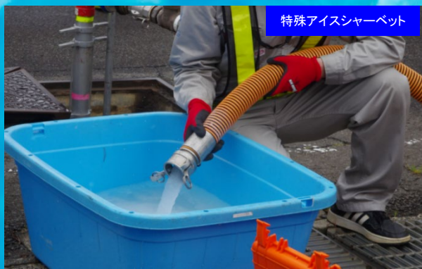
特殊アイスシャーベット

アイスピグ洗浄工法は老朽化した管路をよみがえらせる、管にも環境にもやさしい技術です。